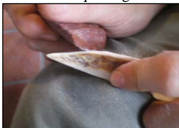
Figura 1. Raspado de hueso durante la formatización de un punzón

1. Seleccionamos un sílex marrón rojizo oscuro, materia prima proveniente de la localidad arqueológica de La María, ubicada en nuestra área de estudio. Este tipo de sílex es preponderante en sitios arqueológicos de la región, y con él se han realizado otras experimentaciones (Cueto y Frank 2004, Frank et. al. 2008). Generamos una colección experimental de referencia de veintitrés lascas. (Ver Tabla 1 al final del documento).